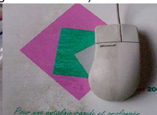
Tapis de souris