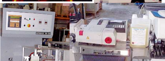
Machines divers dans l'entreprise