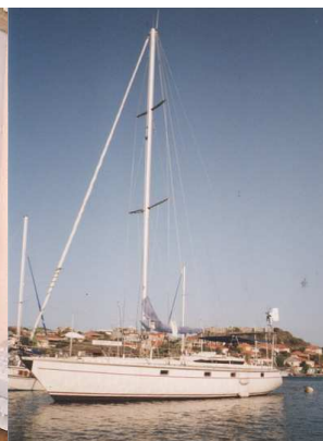
Voiles de voiliers