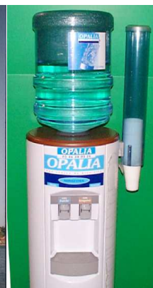
Fontaine à eau