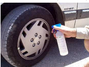
Jantes alu ou acier