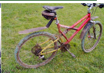
Vélo (huile, graisse et boue).