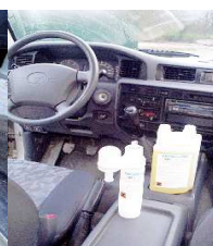
Indispensable partout en voyage