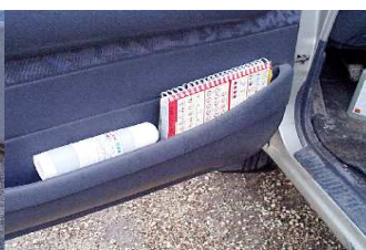
Toujours dans votre vide poche