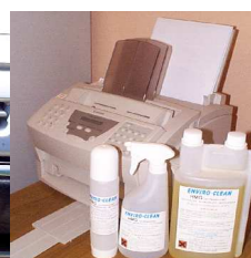
Imprimante et fax