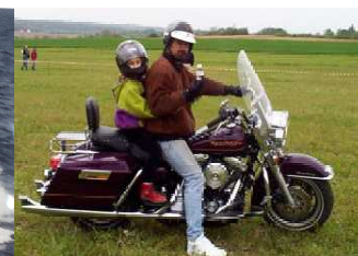
Moto, châssis et moteur