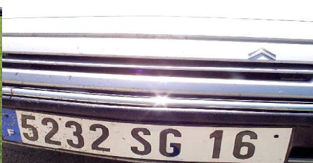
Mouches et moustiques